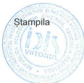
Aliona Lazarev Contabil-șef