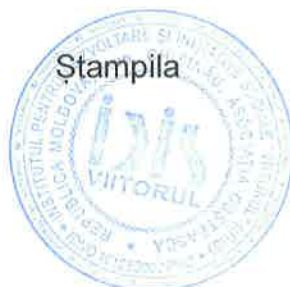
Aliona Lazarev Contabil-șef